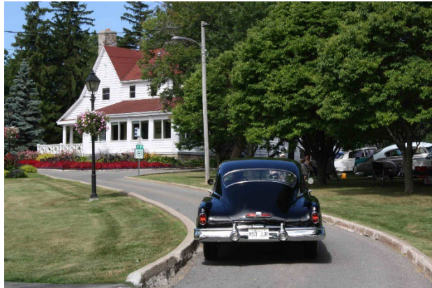
Figure 3 Centre communautaire Fritz

Baie-D'Urfé se distingue par son cadre naturel exceptionnel et son patrimoine paysager riche et varié. La ville est parsemée d'espaces verts abondants, comprenant des parcs, des jardins et des espaces naturels qui créent un environnement serein et esthétiquement plaisant. Ces espaces verts jouent un rôle crucial dans le maintien de la qualité de vie des résidents, offrant des lieux de détente, de loisirs et de contact avec la nature. La présence de nombreux habitats naturels favorise une biodiversité riche, avec une variété de faune et de flore qui enrichit le cadre de vie de la communauté.