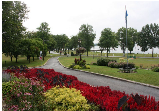
Figure 4 Jardin du centre communautaire Fritz

L'accès privilégié au lac Saint-Louis est un autre élément distinctif du cadre naturel de Baie-D'Urfé. Les résidents peuvent profiter d'une vue panoramique sur le lac, pratiquer des activités nautiques et se détendre au bord de l'eau. Les rives du lac sont soigneusement protégées pour préserver leur beauté naturelle et leurs écosystèmes fragiles. Cette proximité avec le lac contribue à l'identité unique de la ville et renforce son attrait en tant que lieu de vie paisible et naturel.