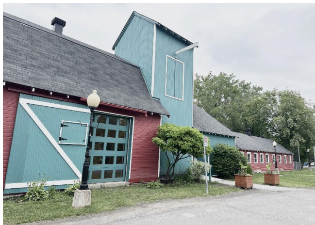
Figure 2 La Grange rouge

Le caractère architectural de Baie-D'Urfé contribue également à son âme unique. Les maisons et bâtiments varient des résidences historiques aux constructions contemporaines, chacune racontant une partie de l'histoire de la ville.