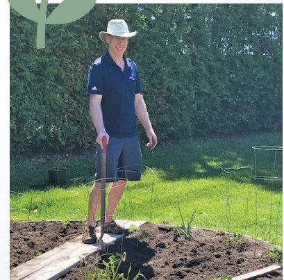
Les opinions exprimées dans cette chronique sont celles de l'auteure et ne reflètent pas nécessairement celles de l'ensemble du Conseil municipal.