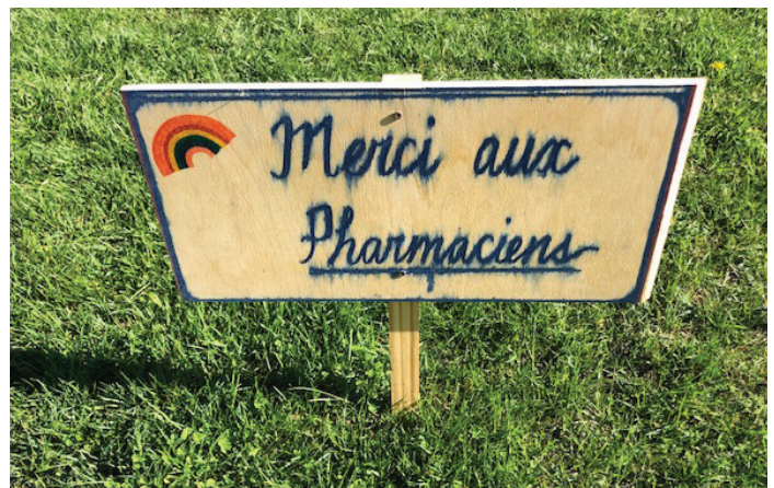
Les opinions exprimées dans cette chronique sont celles de l'auteure et ne reflètent pas nécessairement celles de l'ensemble du conseil municipal.